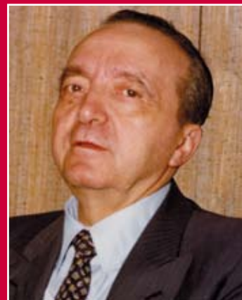
DELL'ANDRO pag. 5