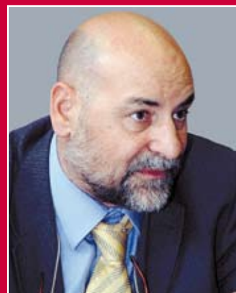
APRILE-FORMEDIL BARI pag. 40